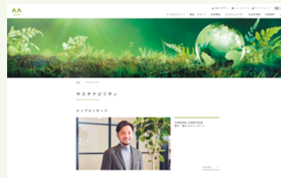
サステナビリティ情報