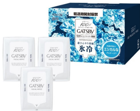
フェイシャルペーパー