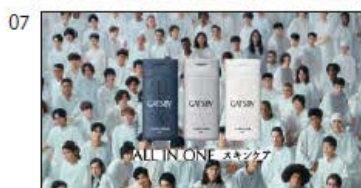
(NA/T) ALL IN ONE スキンケア