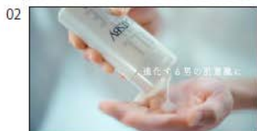
(NA/T) 進化する男の肌意識に