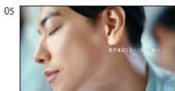
(NA/T) 毛穴目立たないうるおい肌へ