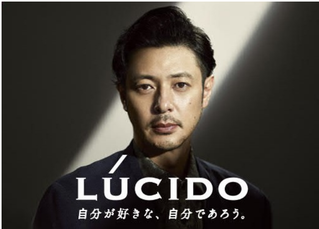
「ルシード」新ブランドビジュアル

株式会社マンダム(本社:大阪市 社長執行役員:西村健)は、ミドル男性用化粧品ブランド「ルシード」の新アンバサダーに、俳優のオダギリジョーさんを起用します。あわせて、「ルシード」新ブランドビジュアルおよび「ルシード薬用パーフェクトスキンクリーム EX」新広告ビジュアルを2023年8月1日(火)より随時店頭展開します。また、オダギリジョーさんが出演する新テレビCMも今秋公開を予定しております。