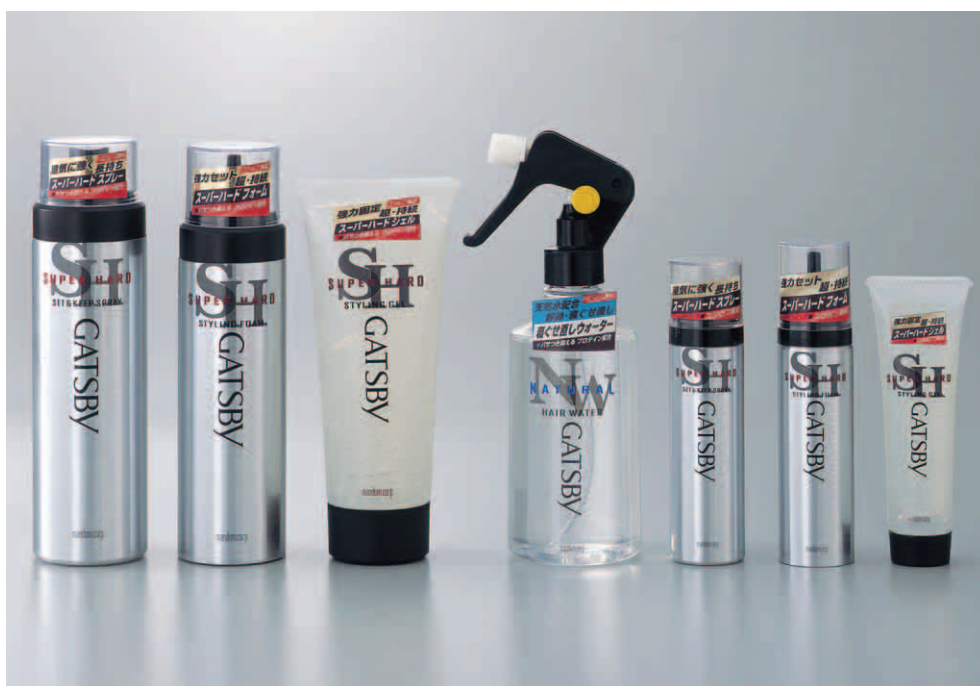
ギャツビー スタイリングシリーズ

思い通りのスタイルをつくり持続する ベーシックなスタイリングシリーズ <旅先・出張先で便利なハンディサイズも充実>