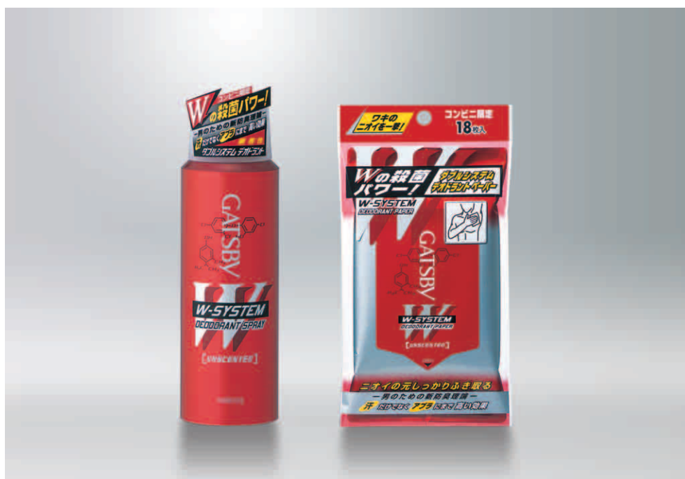
ギャツビー ダブルシステム デオドラントシリーズ (医薬部外品)

2種の殺菌成分[トリクロサン]と[I P M P]をダブルで配合 ニオイ原因菌を徹底的に殺菌し、嫌なニオイを長時間防臭！！