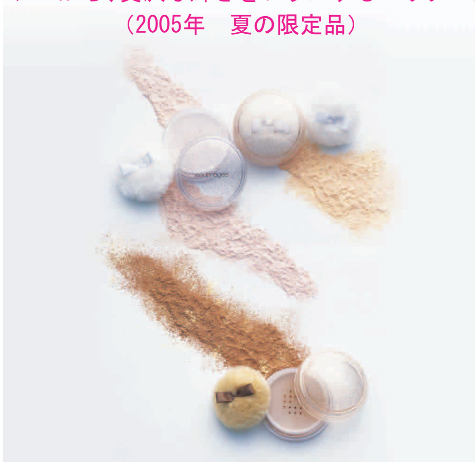
プティ プードゥル ピュール 上段左から 14・13、下段 15

つややかなテラコッタ肌も提案！ クレージュから、贅沢な輝きをプラスするパウダー新発売 (2005年 夏の限定品)