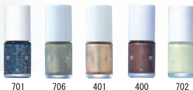
プロモーション用「ヴェルニ コロレ」5色

夏のファッション&メイクアップにふさわしい、鮮烈なインスピレーションを与えます。