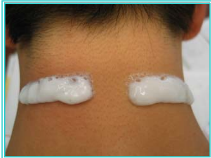
図1 刺激感評価の様子