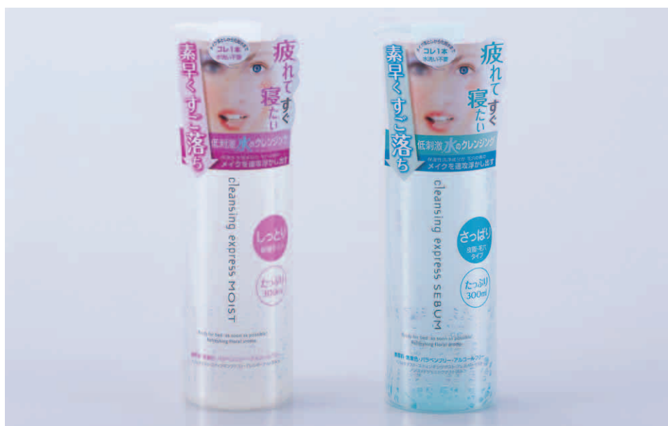
左から、クレンジングエクスプレス クレンジングローション モイスト クレンジングエクスプレス クレンジングローション シーバム 300ml／参考価格 ¥1,155（税抜 ¥1,100）

クレンジングはとっても大事、でもほんとは面倒・・・。 という忙しい女性の本音にぴったりの、すご落ち「水クレンジング」 コットンに含ませふきとるだけで、毛穴に入り込んだ メイクを浮かせ、再付着しないクイックフローティング処方。 しかも洗い流さなくてもOK、メイク落としから化粧水までこれ1本。 メイク落ちの威力とスキンケア効果、忙しい現代女性のためのクレンジングです。