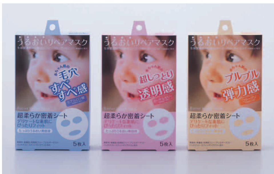
左から、バリアリペアマスクHA（ヒアルロン酸） バリアリペアマスクRO（ローヤルゼリー） バリアリペアマスクCO（コラーゲン） 5枚入／参考価格 ¥945（税抜 ¥900）