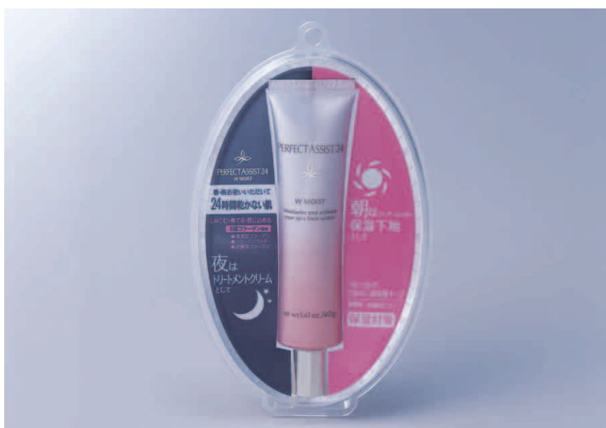
パーフェクトアシスト24 Wモイスト 40g 参考価格 ¥2,100（税抜 ¥2,000）

「24時間乾かない肌」はうるおい美肌の理想。 8割の女性が求めるスキンケアでの保湿効果、パーフェクトアシスト24は 朝は保湿下地として、夜はトリートメントクリームとして トリプルコラーゲンの力で一日中渴き知らずの肌へと導きます。 こっくりとした感触のクリームが滑らかに肌にのび、ぴったりフィット。 肌に溶け込むように浸透し、朝も夜もはたらきかけ 24時間うるおいに満ちたハリと弾力のある肌に導きます。