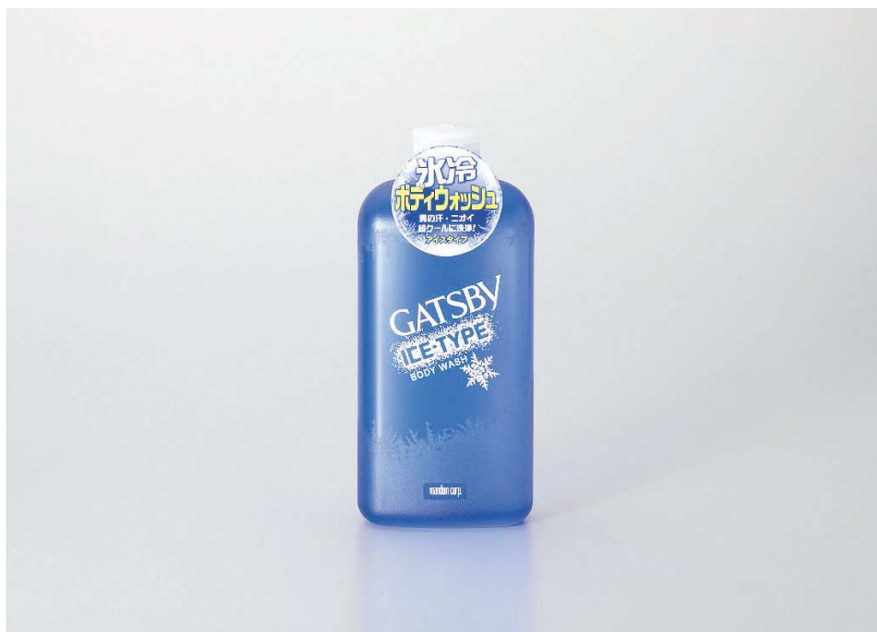
ギャツビー アイスタイプ ボディウォッシュ 300ml ¥577(税抜 ¥550)

マンダムは2010年2月22日(月)、『ギャツビー』から、男の体を超クールに洗い上げる『アイスタイプ ボディウォッシュ』を新発売します。ディープクレンジング成分配合で泡立ちもよく、しっかり洗えるから気になる汗・アブラ・ニオイも強力除去。お風呂上がりも爽快なひんやり感が続く、氷冷ボディウォッシュです。