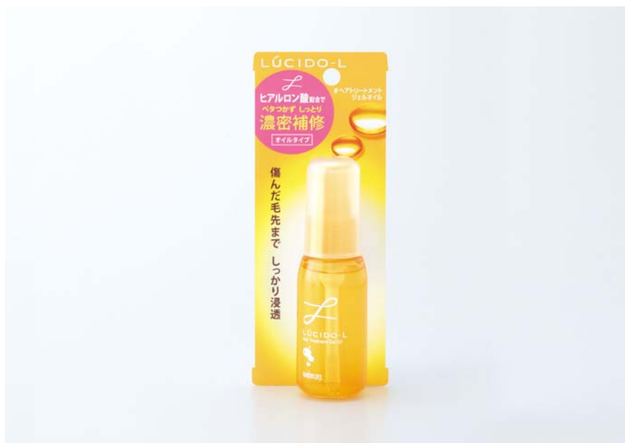
ルシードエル #ヘアトリートメントジェルオイル 60ml ¥893(税抜 ¥850)

マンダムは2010年8月23日(月)、洗い流さずにヘアケアできるヒアルロン酸配合アウトバストリートメントのシリーズから、オイルタイプトリートメントを新たに発売します。髪内部に浸透するタイプと髪表面をコーティングするタイプの2種類のヒアルロン酸を配合。しっかりうるおうのにベタつかない濃密ジェルオイルが、傷んだ毛先まで包み込み、ダメージをじっくり補修します。