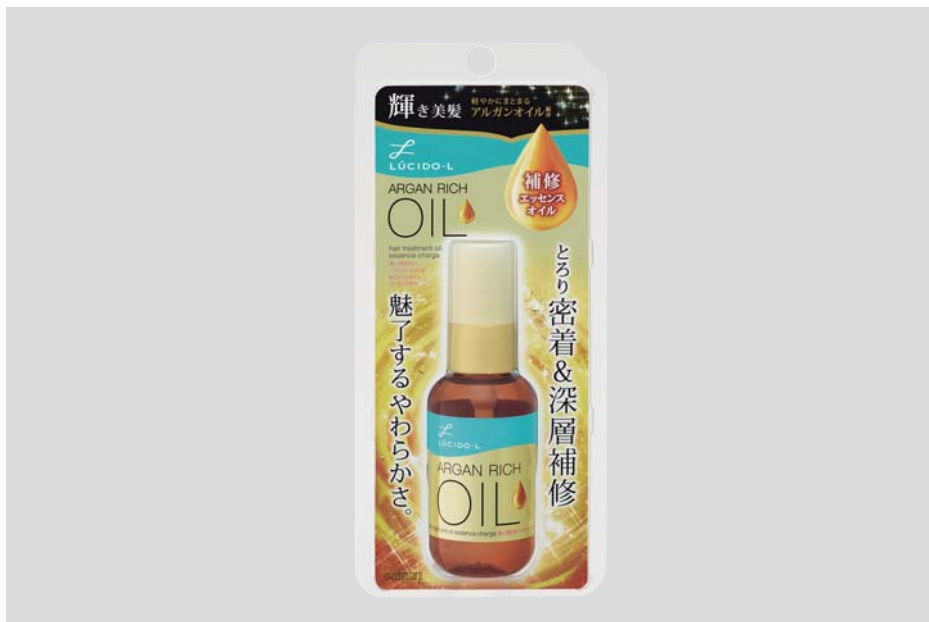
ルシードエル オイルトリートメント #EXヘアオイル エッセンスチャージ 58ml ¥1,200(税抜)

マンドム(本社:大阪市 社長執行役員:西村元延)は、「ルシードエル オイルトリートメントシリーズ」から、ダメージをしっかり補修し、芯からやわらかな髪に仕上げる新機能補修オイル「ルシードエル オイルトリートメント #EXヘアオイル エッセンスチャージ」を、2016年8月29日(月)より新発売します。