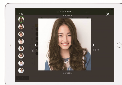
求める髪色をビジュアル化