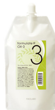
フォーミュレイトファイ OX-3 1,000ml (美容室専用品)

ピアセラボでは、今後も独自の技術を活かしたプロユースの商品や技術・サービスを提案し、美容業界の発展に向けて取り組んでいきます。