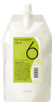
フォーミュレイトファイ OX-6 1,000ml (美容室専用品)