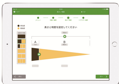
ベースの髪の状態を入力