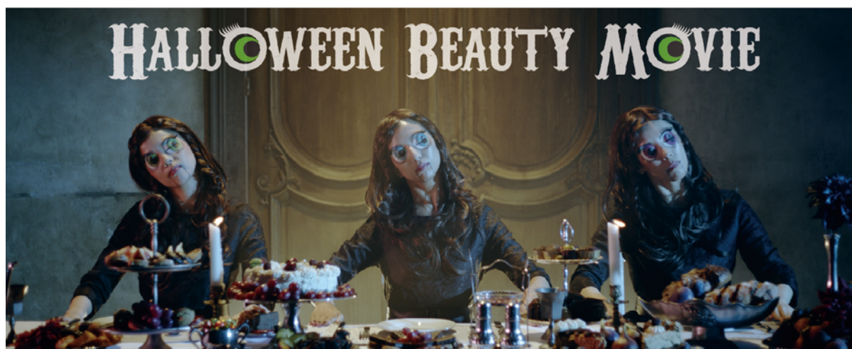
『HALLOWEEN BEAUTY MOVIE』 https://youtu.be/OoghgTFFUCY

実際にムービー内に登場する“デカ目女子”も登場し、フォトスペースで一緒に撮影も楽しんでいただけます。