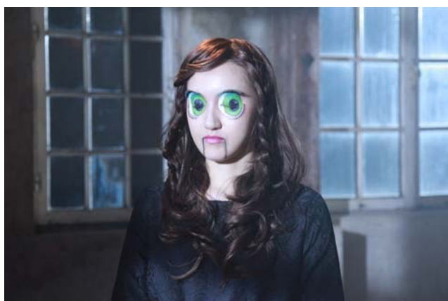
メイク落とし前(特殊メイク時)

ハロウィン当日、メイクをしたまま帰宅するのが恥ずかしいという方は、ぜひ、うる落ち水クレンジングシリーズをバッグに忍ばせて帰宅前に使用してみてください。