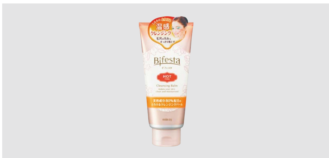
ビフェスタ クレンジングバーム ホットタイプ