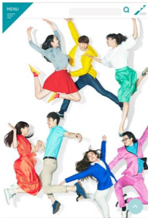
【スマートフォン トップ画面】