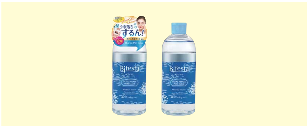
ビフェスタ クレンジングローション デュアルフェイズ ポアクリア