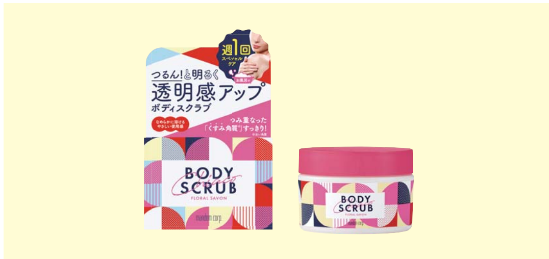
マンダム チアコ ボディスクラブ フローラルシャボン