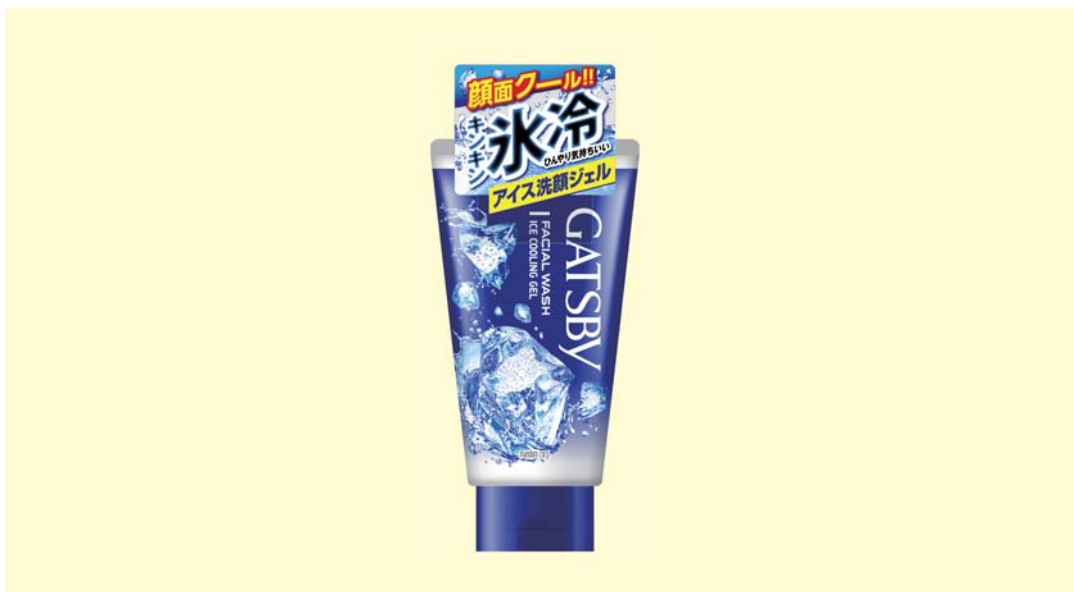
ギャツビー フェイシャルウォッシュ アイスクーリングジェル