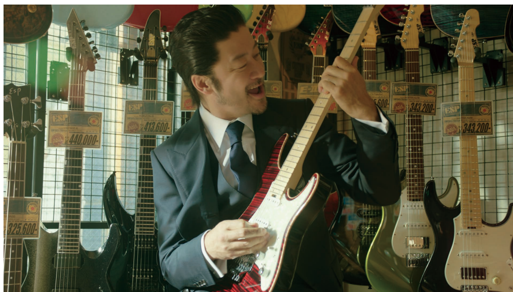
新CM『ギターショップ篇』30秒

株式会社マンダム(本社:大阪市、社長執行役員:西村健)は、ミドル男性用化粧品ブランド「ルシード」のイメージキャラクターに、俳優・浅野忠信さんを引き続き起用し、「ルシード 薬用スカルプデオシャンプー」の新CM『ギターショップ篇』(15秒・30秒)をYouTubeルシード公式チャンネルで4月27日(火)より先行公開、5月1日(土)より全国で順次オンエア致します。